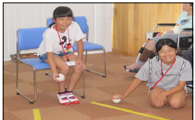
【なぎ園体験の様子】

7月1日～8月31日は、「広がれボランティアの輪」連絡協議会が提唱する「ボランティア体験月間」です。