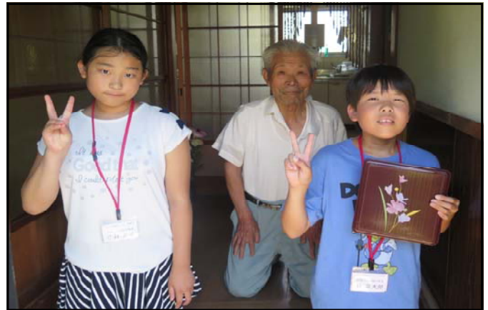
【配食サービス体験の様子】