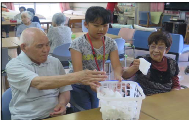
【デイサービス体験の様子】